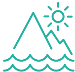
Mirador de Son Moles 17255 Begur