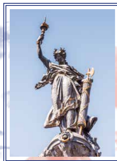
→ Monument als herois del Primer Crit per a la Independència, 1809, a Quito, Equador.

— En el nou ordre social aparegut a les antigues colònies una vegada assolida la independència, les dones continuaren sense ser considerades ciutadanes de primera: la política era cosa d'homes. Acabada la guerra, les condicions de la dona pel que fa a la igualtat amb els homes en el camp polític i l'educació romangueren igual. Després d'haver lluitat en el camp de batalla, d'haver participat en totes les vicissituds del conflicte, les dones tornaren a ocupar-se de les seves tasques tradicionals dins l'àmbit domèstic, com si res no hagués passat.