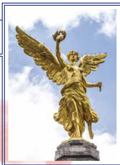
→ Àngel del monument a la independència de Mèxic, Ciutat de Mèxic.