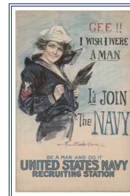
→ Al llarg de la història, moltes dones han desitjat poder allistar-se a l'exèrcit, en igualtat d'oportunitats que els homes. Cartell de propaganda de la Primera Guerra Mundial (1917): “Si jo fos home, m'allistaria a l'armada”.

— A la independència d'Equador, Colòmbia o Perú, entre d'altres, va tenir un paper destacat MANUELA SÁENZ AIZPURU (1795-1856), finalment reconeguda com a gran heroïna i com a precursora del feminisme a Amèrica Llatina. Pertanyent a l'elit criolla de Quito, va rebre l'educació típica de l'època, però preferí deixar una vida acomodada per servir els seus ideals de llibertat. Se la recorda especialment per haver deixat el seu marit per marxar amb Simon Bolívar —el Libertador—, que la nomenà coronel de l'exèrcit colombià i a qui ella va salvar la vida en un atemptat. Manuela va morir a l'exili, oblidada de tots, havent trencat, però, tots els cànons socials i de sexe de la seva època.