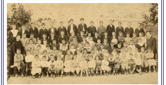
→ Alumnas de l'Escola de Nostra Senyora del Carme. ( © AIAB. Fons Ajuntament de Begur ) Autor > Jaume Ferrer Massanet. 1906

— L'Arxiu Històric de Begur conserva en el seu fons nombroses fotografies de dones indianes . D'algunes en tenim notícies, sovint anecdòtiques, d'altres en podem traçar simples però sucoses semblances, i de la resta ho desconeixem tot. Cal continuar investigant, treballant, per treure-les totes de l'anonimat.