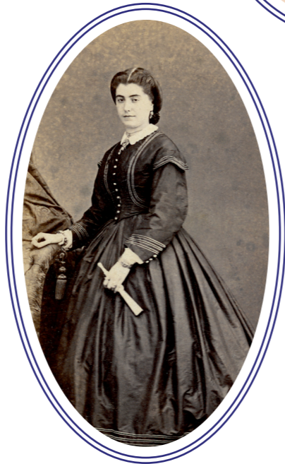
→ Hi ha encara un munt de dones begurenques, moltes vinculades a indians, esperant que les rescatem de l'oblit de la memòria.