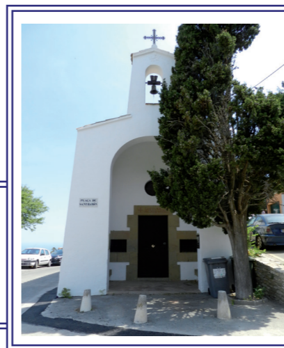
→ Ermita de Sant Ramon de Begur després de la reconstrucció finançada per Maria Lladó. ( © AIAB. Fons Ajuntament de Begur ) Autor > Núria Casellas. 2015