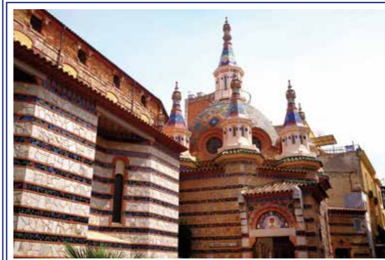
→ Capella del Santíssim de la parròquia de Sant Romà de Lloret de Mar.