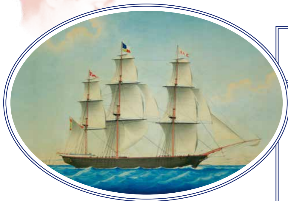
→ Pintura de la corbeta BLANCA AURORA.