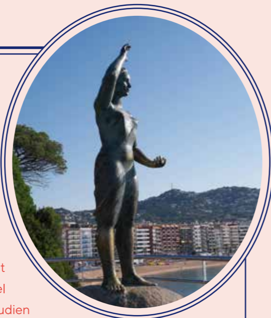
→ LA DONA MARINERA, escultura en bronze d'Ernest Maragall, 1966, homenatge de Lloret de Mar a les dones que acomiadaven o saludaven els estimats partits cap a Amèrica. ( © Ramon Soler Pascuet )

Els arxius catalans conserven encara les autoritzacions que s'atorgaven per a què infants i joves —que aleshores no obtenien la majoria d'edat fins als vint-i-cinc anys— poguessin emprendre legalment el viatge cap a les colònies; s'intentava d'aquesta manera lluitar contra la clandestinitat. Tot i que la majoria d'aquestes autoritzacions són signades pel patriarca —el pare—, és cert també que en moltes apareix la signatura de la mare, normalment vídua o amb el marit absent de la llar, sovint per trobar-se també a l'altre costat de l'oceà.