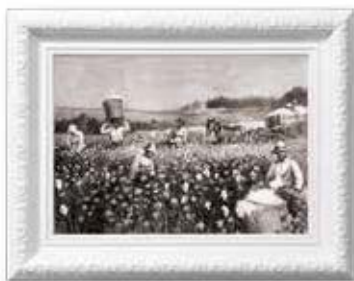
→ Plantació de cotó al sud dels Estats Units.