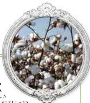
→ El cotó és la fibra natural més produïda al món.

E N POC TEMPS, EL TEIXIT DE COTÓ I LLI MANUFACTURAT A CATALUNYA ANÀ ARRACONANT A LES ANTILLES LA LLANA, INTRODUÏDA EN UN PRIMER MOMENT PER CASTELLANS I ANDALUSOS, ELS TAFETANS I ELS TEIXITS DE SEDA, TAMBÉ D'ORIGEN ESPANYOL, I FINS I TOT ELS DE LLI FABRICATS A REGIONS TAN IMPORTANTS COM LAVAL (FRANÇA) O LANDSHUT (ALEMANYA).