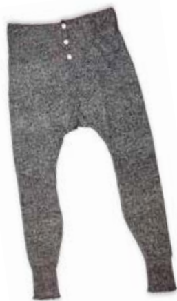
→ Calçotets llargs. Llana, punt llis. c. 1880-1910. MaM 17086, col·lecció Fundació Jaume Vicens.