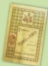
→ Libre d'exportació Sobrino de Antonio Regás, Mataró 1899. Paper imprès. MaM 17676, col·lecció Fundació Jaume Vicens.

Igual d'èxit van tenir les teles de ll, els anomenats llenços, que importades en cru del nord d'Europa eren estampades a les fàbriques barcelonines i enviades, amb molt bona sortida, al mercat colonial. Així mateix, els comerços antillans es veieren ben replets de milers de canes de puntes al coixí, de poc pes i preus alts, i per molt de gènere de punt, producte de tipus econòmic, especialment de color –mitges de seda i de cotó, samarretes i calçotets, i, amb molt d'èxit, els apelfats–, realitzat a Mataró.