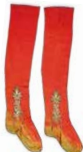
→ Mitja. Seda, brodat fil de plata representant motius vegetals, segle XVIII. MaM 17167, col·lecció Pilade Franceschi.