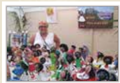
Una de les parades de la Fira CARRERAS