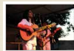
Ambientació musical a la plaça Esteva i Cruañas CARRERAS