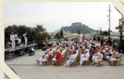
El grup Peix Fregit actuant a la plaça Forgas CARRERAS