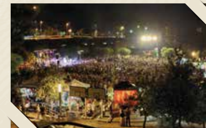
El parc de l'Àrbreda ple de gom a gom CARRERAS