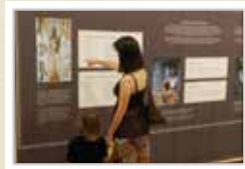
L'exposició La gastronomia indiana AJUNTAMENT DE BEGUR