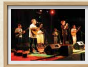
Ball de fi de Fira a l'Arbreda CARRERAS