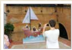
Un "viatge" per focà CARRERAS