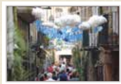
Carrers guarnits per celebrar la Fira CARRERAS