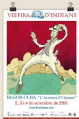
Cartell de la 8a edició

I la Fira va mostrar també la seva cara més solidària amb la conferència de Fòrum Solidari, que combina el suport als casals catalans de Cuba amb l'ajuda humanitària als barris més humils de l'Havana i rodalies.