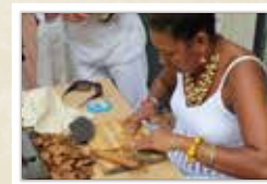
Una torcedora elaborant cigars havans CARRERAS