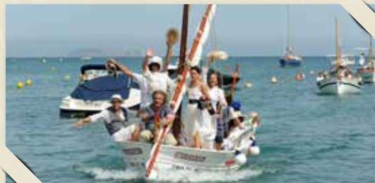
Escenificació de l'arribada de l'indià a Sa Riera CARRERAS