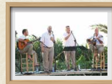
Actuació de l'Empordanet CARRERAS