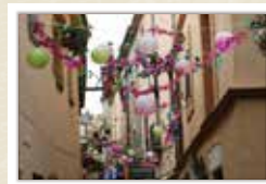
Decoració d'un dels carrers de la vila CARRERAS