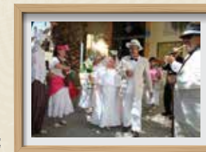
Esquetx del grup de teatre Es Quinzè CARRERAS