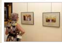
Exposició Els indians en la intimitat CARRERAS