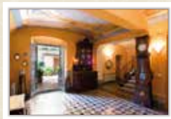
Exposició Els indians en la intimitat CARRERAS