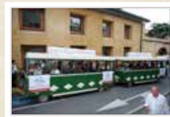
El trenet de la Fira CARRERAS