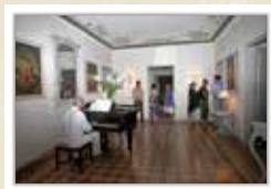
Visites a la casa indiana de Can Sora CARRERAS