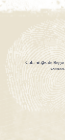
Cubani@s de Begur CARRERAS