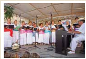
Actuació de la Coral de la Gent Gran CARRERAS