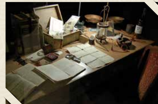
Aparador decorat PERE CARRERAS