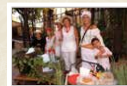
La Fira dels begurens CARRERAS