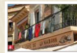
Ambientació i decoració d'una de les cases de la vila CARRERAS