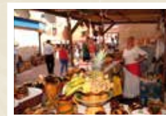
Mercat d'ultramar CARRERAS