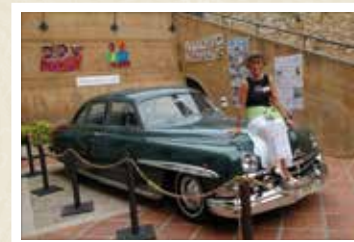
Exposició d'un cotxe Lincoln del 1949 CARRERAS