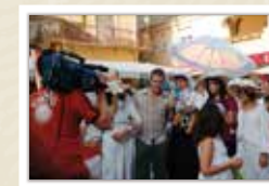
Els mitjans de comunicació seguint la Fira CARRERAS