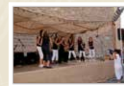
Actuació de l'Escola de Teatre de Begur CARRERAS