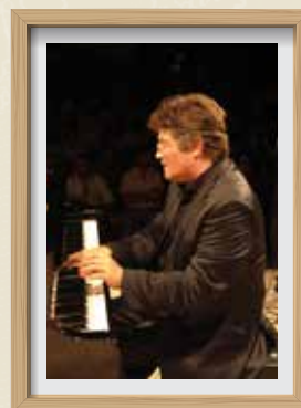
El pianista Chano Domínguez al pati de les Escoles Velles CARRERAS