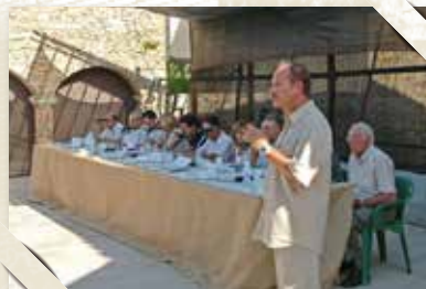
I Fòrum de Municipis Indians CARRERAS