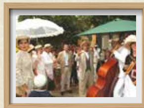
Alcalde i regidors durant l'escenificació d'El retorn de l'indià CABRERAS