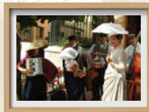
L'Orquestrina Les Violetes CABRERAS