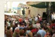
Actuació de la nena Serena CABRERAS