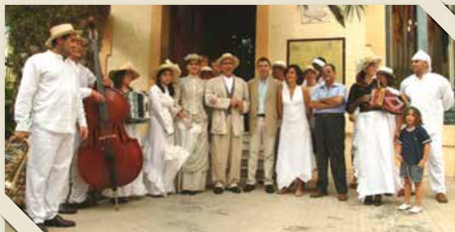
Alcalde i regidors durant l'escenificació de "El retorn de l'indià" CABRERAS