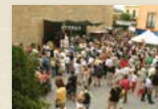
El grup Barnhabana a la plaça de la Vila CABRERAS