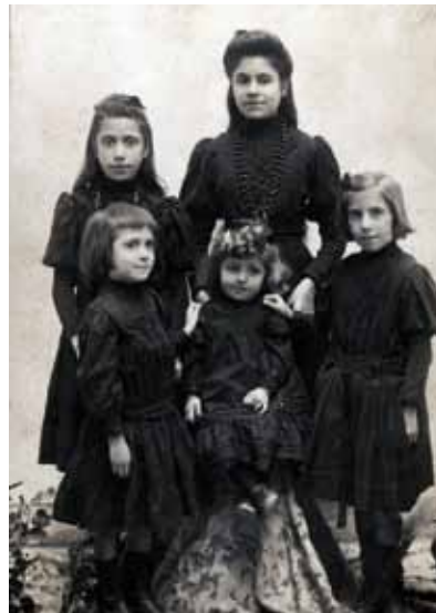
Els vestits negres d'aquestes germanes són símbol de dol, possiblement per la pèrdua d'algun familiar.