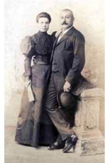
Matrimoni Caner. Un dels passos del retorn de l'americano era trobar una dona i formar família.