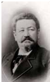
Els vestits negres d'aquestes germanes són símbol de dol, possiblement per la pèrdua d'algun familiar.